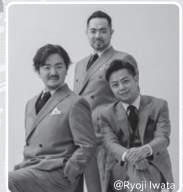
@Ryoji Iwata それいけ!クラシック

【曲目】 ♪組曲「惑星」より「木星」 ホルスト(山本直人 編) ♪オ・ソーレ・ミーオ カプア ほか