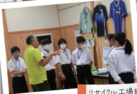
リサイクル工場を見学