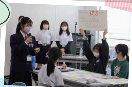
高陵中学校3年生。合唱部所属。 第15期(令和5年度)結いジュニアリーダー育成講座副リーダー。