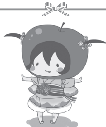
イメージキャラクター「ゆいたん」