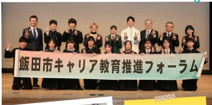
フォーラム登壇者の 皆さんと