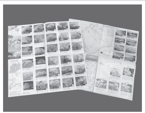
改訂した「上久堅の桜ガイドマップ」